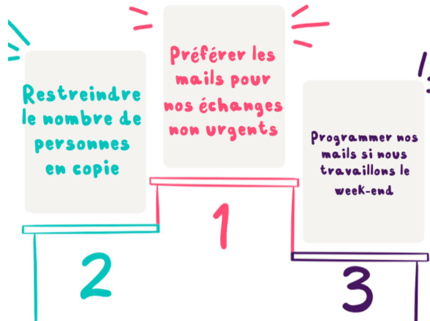
Top 3 des actions à mener

Pour bien conclure l'exercice , posez des questions concrètes : « Quelles actions allez-vous prendre dès demain suite à ce top 3 ? »